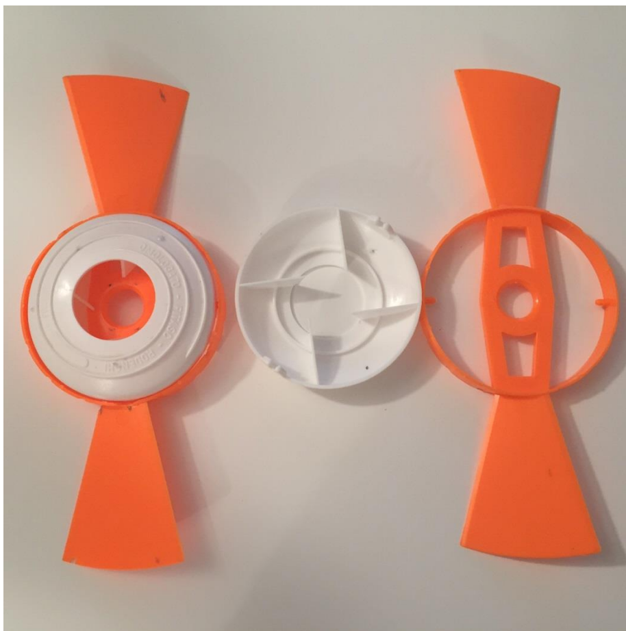
PHOTO D'UNE HELICE RECTO VERSO

Sur décision de la commission de tir aux hélices, la couleur de l'hélice porteuse ou du témoin peut être de toute autre couleur qui en faciliterait la visibilité. Dans tous les cas de figure, lors d'une compétition, sera utilisée sur toutes les installations une seule couleur pour l'hélice porteuse et une seule couleur pour le témoin.